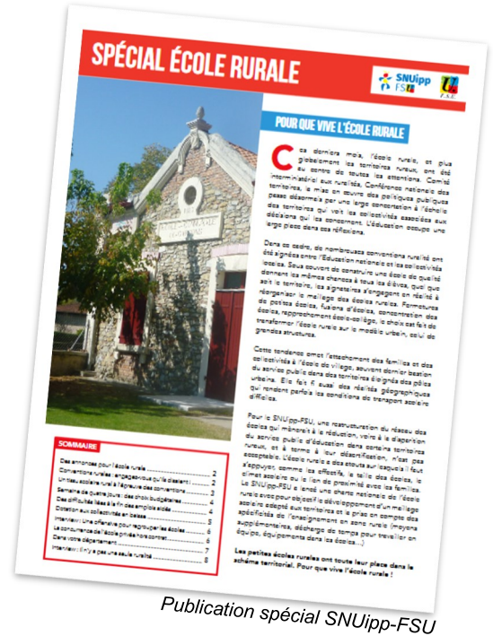
Publication spécial SNUipp-FSU

Les petites écoles rurales des Vosges ont toute leur